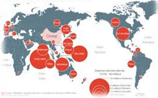
La diaspora chinoise dans le monde